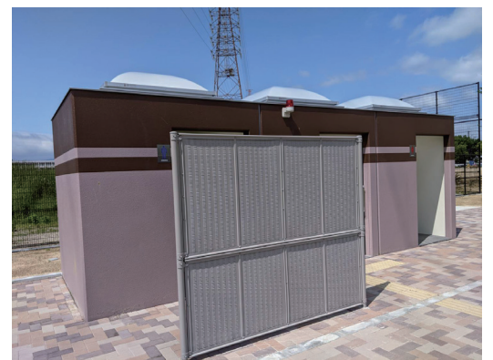
男性トイレの目隠しフェンス

2月15日の話し合いでは、男性トイレには目隠しになるフェンスの設置を検討するとの回答がありました。グラウンドの水はけについては、2月、3月に繰り返し改善を求めてきました。5月1日に再度、市に対応を求めると、5月中旬に水がたまる場所に配管を増設する工事をすると回答がありました。その後、男性トイレの目隠し用フェンスの設置は完了しています。また、水はけ改善については改善工事後、経過観察されます。